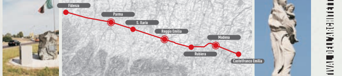
Nell'ambito dell'esposizione: HABITARE LA VIA EMILIA, Porta S. Stefano, Reggio Emilia.

Attraverso il monumento To Emilia, tra riscoperta e segnatura degli elementi insediativi